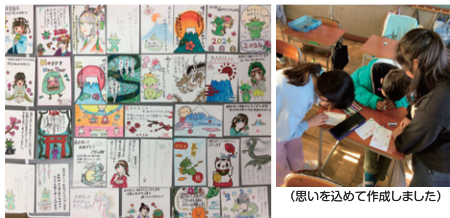
(いろいろな年賀状ができました)

市内福祉協力の小・中学生にご協力いただき、ひとり暮らし高齢者など約200名に心のこもった年賀状を送付しました。