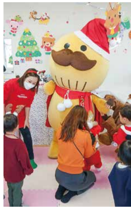
みんなdeハッピークリスマス会