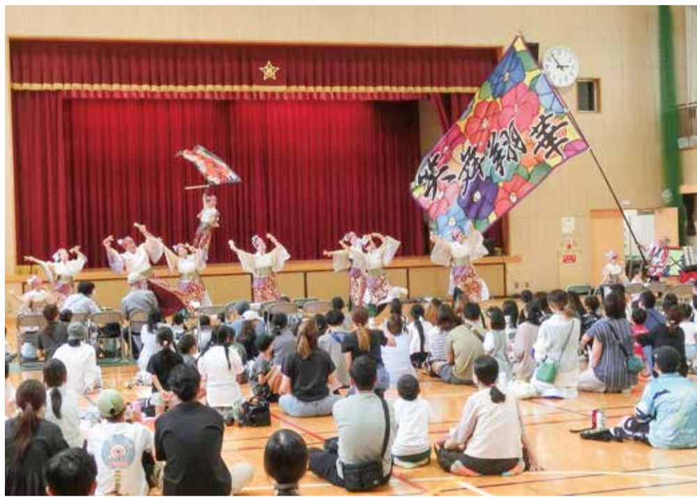
地域住民交流イベント(西校区福祉まつり)

本年3月、理事会・評議員会を開催し、各理事・評議員の承認を得て、令和8年度の事業計画・予算を決定しました。