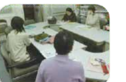
あんしんコール事業