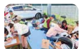
住民交流イベント