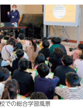
東小学校での総合学習風景