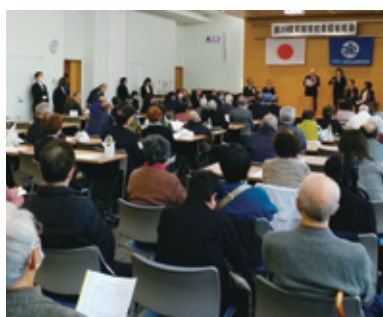
社会福祉総会式典風景

本年3月、理事会、評議員会を開催し、各理事・評議員の承認を得て、令和6年度の事業計画・予算を決定しました。 人口減少、少子高齢化が進行する中、地域住民が抱える課題は、8050問題やダブルケア、生活困窮、児童や障害者への虐待、社会的孤立など複雑化・複合化しています。 特に今年度は、推進2年目の「第5次貝塚市地域福祉活動計画」の進捗管理を行いながら計画の着実な実施に努めます。 また、高齢者や障害のあるかたの権利擁護のための成年後見制度については、関係者のコーディネート機能を担う中核的な機関の設置に向け、行政と協議・準備を行い、重層的支援体制整備事業においては、「地域づくりに向けた支援事業」を受託し、住民同士が出会い参加できる居場所づくり等を通じてお互いに支えあえる地域づくりを推進します。