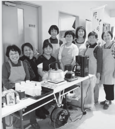
コーヒーの準備は万全