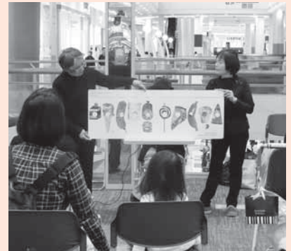
大型絵本の読み聞かせ

き、紙芝居や民話などの読み聞 かせを行っています。皆さんに 分かりやすい言葉で伝えるため 定期的に勉強会も開いています。