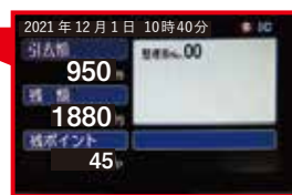
▲運転席付近の表示画面 引去額にICカード割引運賃を表示