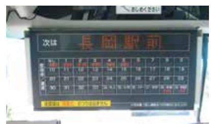
▲バス車内前方にある運賃表モニター 現金でお支払いの区間運賃を表示