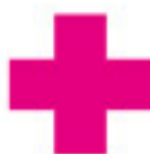
赤十字(せきじゅうじ)

「赤十字マーク」は、赤十字の創設者アンリー・デュナンの祖国であるスイスに敬意を表するために、スイス国旗の配色「赤地に白い十字」を反転して、「白地に赤い十字」としたものです。なお、多くのイスラム教国は、十字はキリスト教を連想させるとして、赤十字の代わりに「赤新月」を使用しています。使用した時の条件効力は「赤十字」と一緒です。また、平成19年1月14日にジュネーブ条約の第3追加議定書が発効され「赤十字」として新たな標章が追加されました。新たな標章は、白地に赤いひし形を配したものの「レッドクリスタル」となっています。