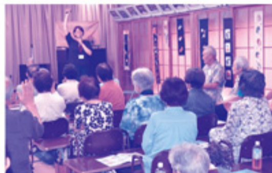
水分補給の大切さについてお話していただきました。