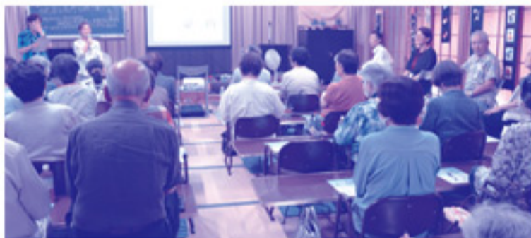
「健康と長寿を願う集い」が開催され、約50名が参加しました！