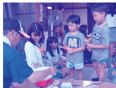
子ども会による綿あめも大好評！