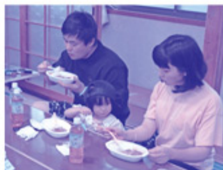
特製カレーライスは甘口と辛口の2種類がありました。