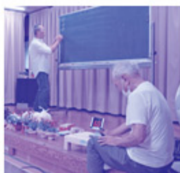
豪華景品がもらえるビンゴゲームは、2回戦まで行われ、盛り上がりました。