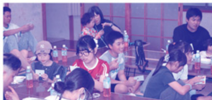
ビンゴカードを見つめる目は真剣です！