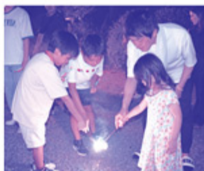
手持ち花火も楽しかった！