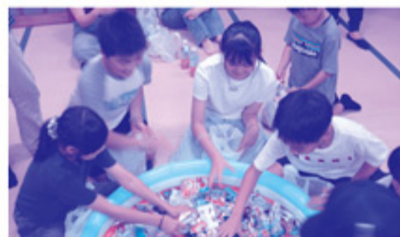
お菓子のつかみ取りでは、袋いっぱいのお菓子里に大満足の表情でした！