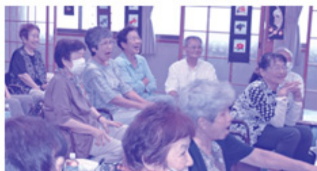
住民さんのトークショーにみんな大笑い！