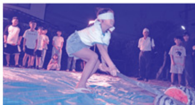
大きなスイカが割れた瞬間、歓声があがりました！