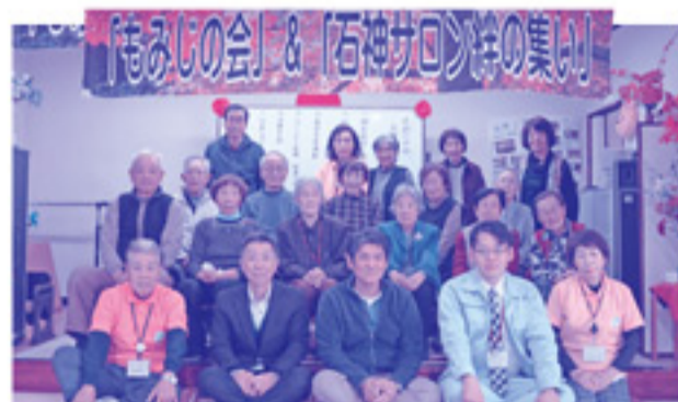
毎年恒例の記念撮影!