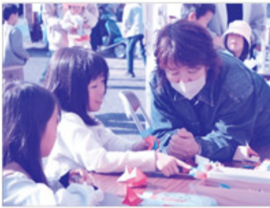
地域の方の折り紙教室や、竹とんぼやこまなどの昔遊びに子どもも大人も何度も挑戦しました。