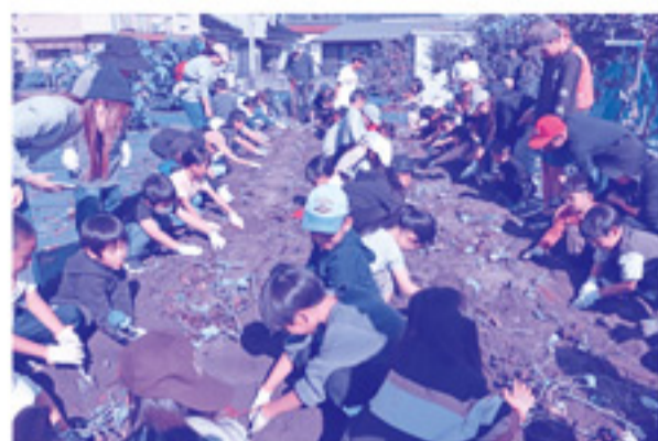
昨年以上の参加者でにぎわいました。