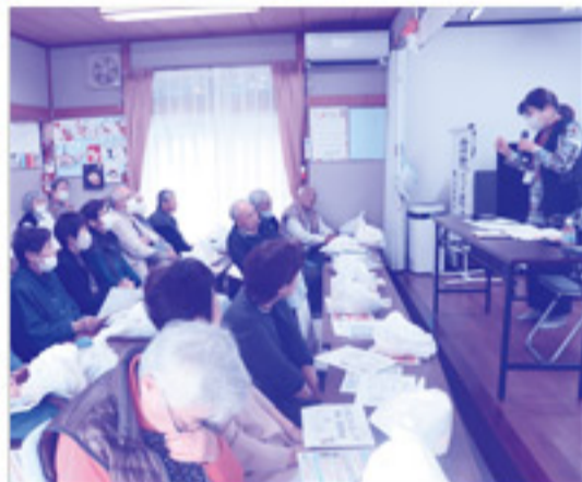
特殊詐欺の講座に真剣に耳を傾けます。