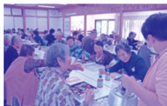
みんなで過ごす昼食の時間は、笑顔が絶えませんでした。