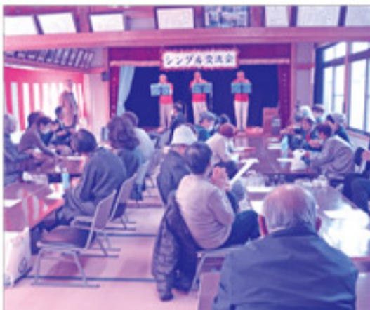
ハーモニカのソロ演奏の後は大きな拍手が響きました!