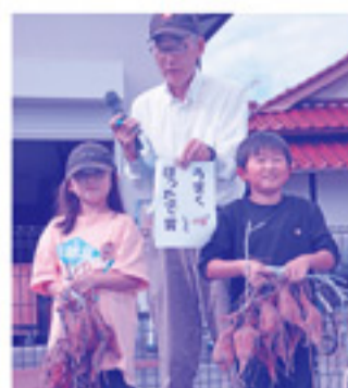
最後に表彰式も行われました。