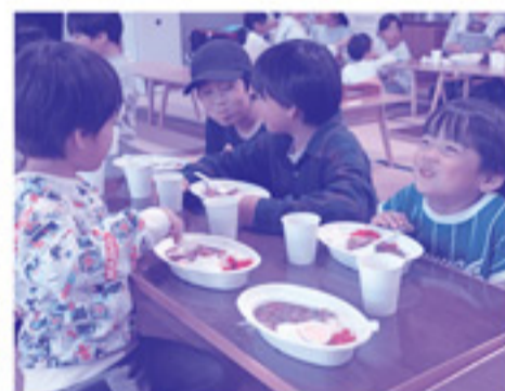
特製カレーは自然と笑顔になるくらい美味しかったです。