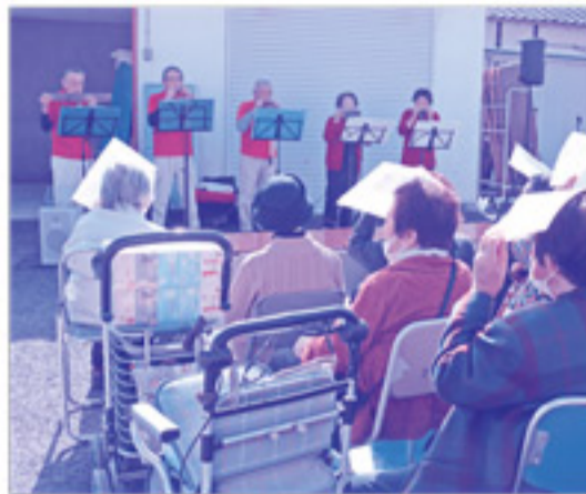
野外ステージでのハーモニカ演奏や手話ダンスなどを楽しみました。