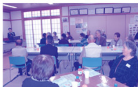
エレクtoonに合わせて歌をうたいました。