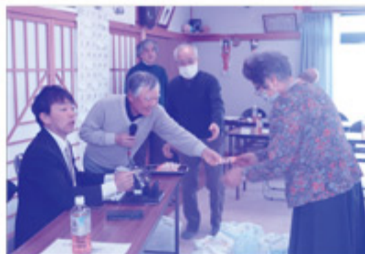
お楽しみのビンゴゲーム！ビンゴになった方から順に好きな賞品を選んでいきます！