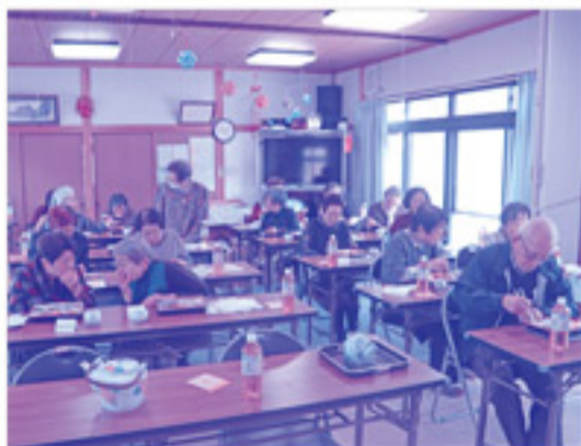
みんなで食べる昼食は、いつもより美味しく感じます。