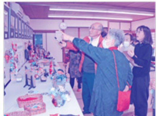
集会所内では、地域の方の作品を展示。薫ぶき屋根の写真を懐かしそうに眺める方もいました。