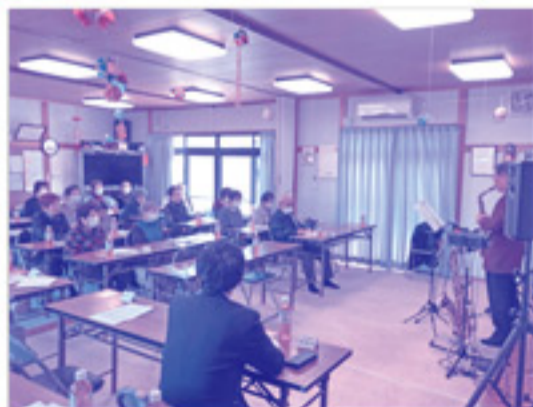
サクソの音色と共にみんなで歌をうたいました！