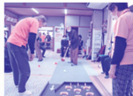
チームに分かれてゲームをしました。