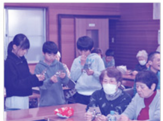
ビンゴゲームの上位の方には豪華賞品が!「ビンゴを楽しみにしていた」という方も!