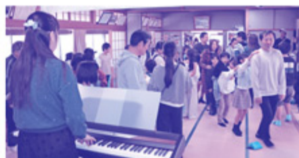
参加者全員でじゃんけん列車をしました!