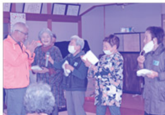
入賞チームのインタビューでは、「この日を楽しみにしていた」「来年も参加したい」というコメントがありました！