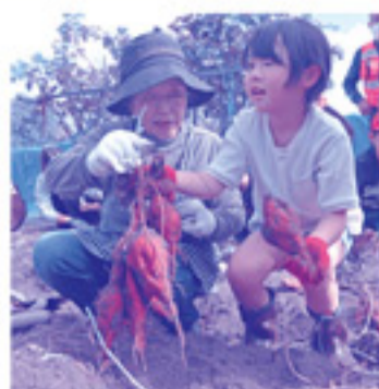
地域の方と一緒に上手に掘りました!