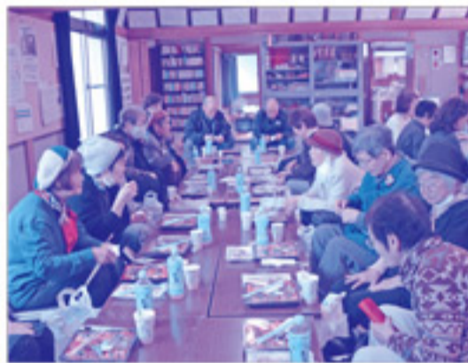
昼食はお弁当と石窯で焼いた手作りピザ!楽しいおしゃべりと共に美味しく食べました。