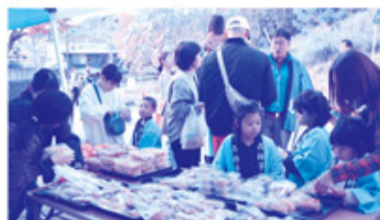
バザーも行われ、大好評でした。