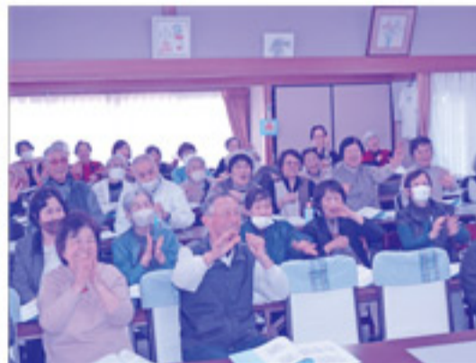
歌の合間のリズムゲームは脳トレのようで夢中になりました。