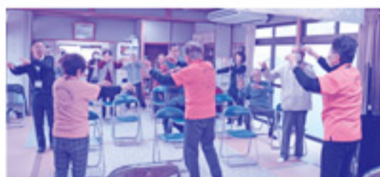
ゆらっとくまとシルバーリハビリ体操で心も体も元気に!