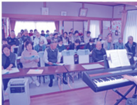
エレクトーンの伴奏に合わせて、大合唱！