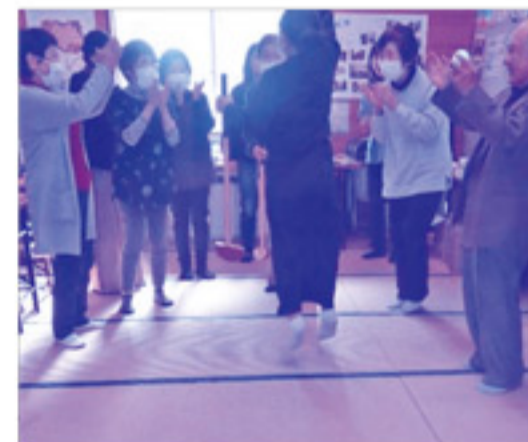
グループ対抗のゲームでは、入賞目指して一致団結!