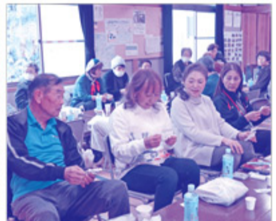
お楽しみのビンゴゲームは、全員に賞品がありました。