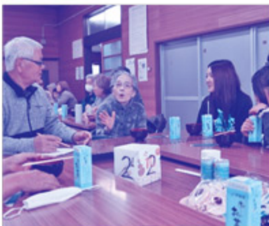
呉地地区の困りごとや「あったらいいな」をグループで話し合いました。