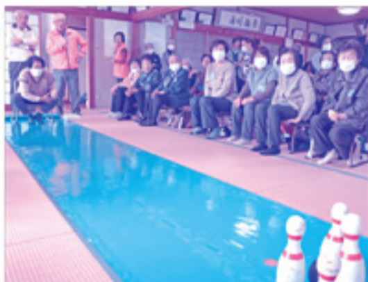
今年はチーム対抗のボウリングで大盛り上がり！