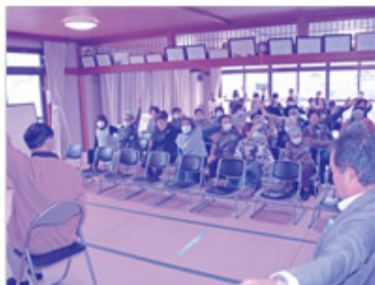
座ったままできる体操で、レクリエーションの準備をしていきます。