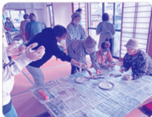
みんなで協力して準備をしていきます。