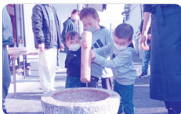
大きな杵を協力して持って餅をつきました。