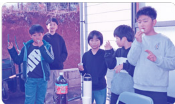
つきたての餅は柔らかくて美味しかった!