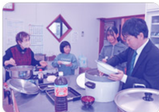
特製カレーライスは大好評で、あっという間にお鍋は空っぽに!