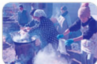
大きなお釜で八寸とご飯を炊いていきます。