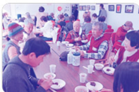
手作り豚汁も準備されており、豚汁の中 に餅を入れて食べる方もいました。