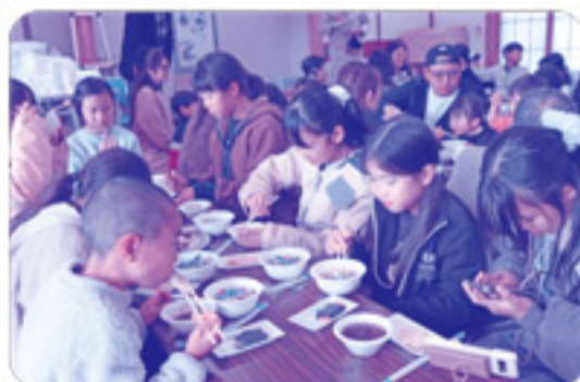
自治会館に入りきらないくらいの参加者 で食事を楽しみました！