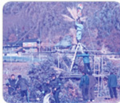
子ども会が中心となり、とんとを組んでいきます。