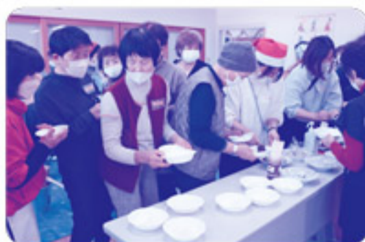
普段なかなか食べられない杵つき餅は 大好評でした！