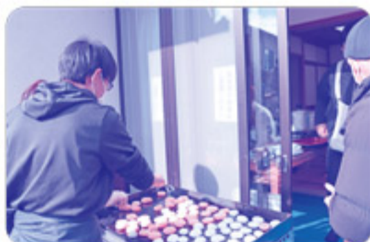
焼き餅やぜんざい、ふかし芋、特製豚汁など が用意されました！