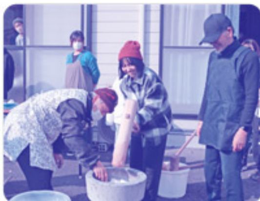
餅つき体験。返し手さんとタイミングを合わせて餅をつくのは難しい!