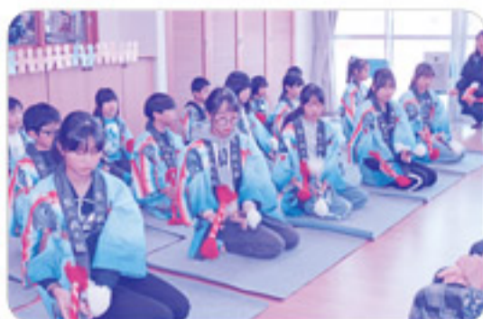
オープニングの第二小学校の児童による 銭太鼓のパフォーマンスは息びったり！