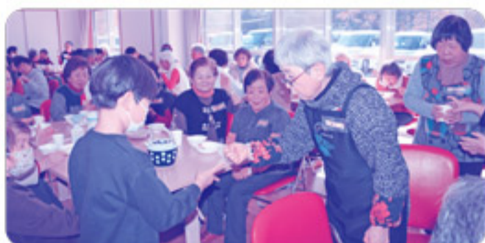
地域の方とのじゃんけんゲーム。ゲームをと おして親睦を深めました！