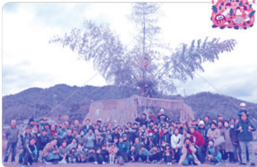
平谷地区の皆さんの力で立派なとんとが完成しました！