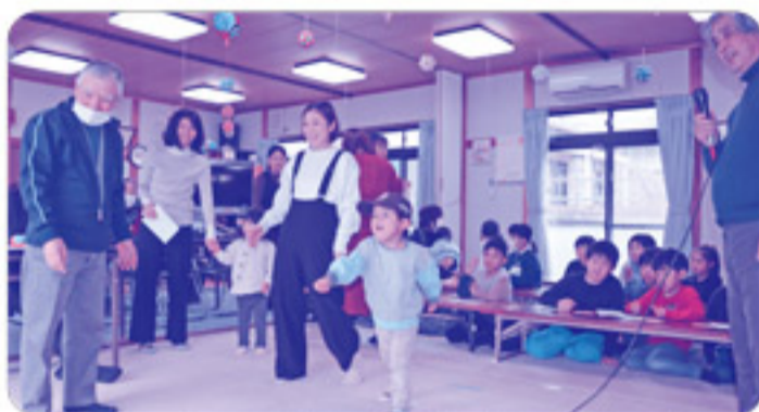
ターゲットゲームや輪投げで点数を競い、得点の多かった方には賞品が贈られました!