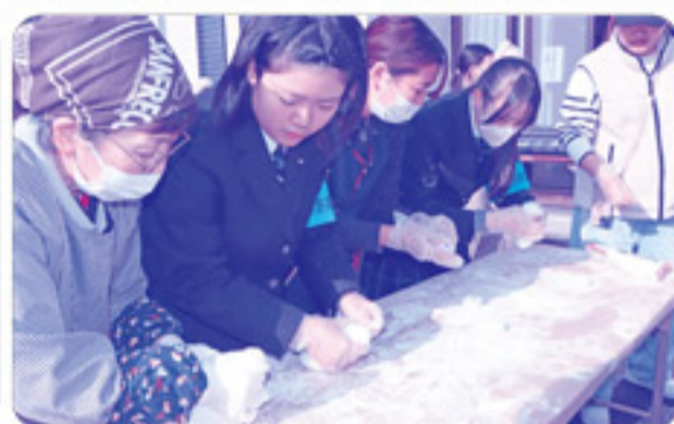
地域の方に餅を上手に丸めるコツを教わります。