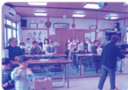
最後の方がビンゴになると、参加者からは大きな拍手と笑顔があふれました。