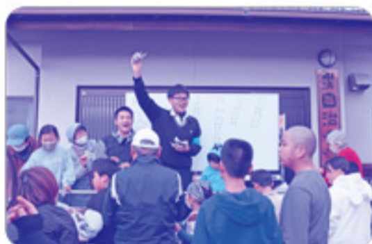
ビンゴゲームでは、熊野高校の生徒さんが 司会を務め、盛り上げてくれました！