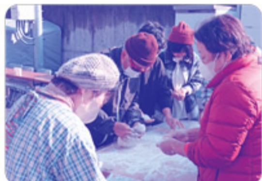
ついた餅はすぐに丸められ、参加者に振舞われます。