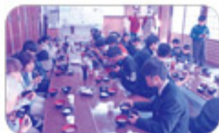
寒い日でしたが、大人数での食事とおしゃべりで心も体も温まりました。