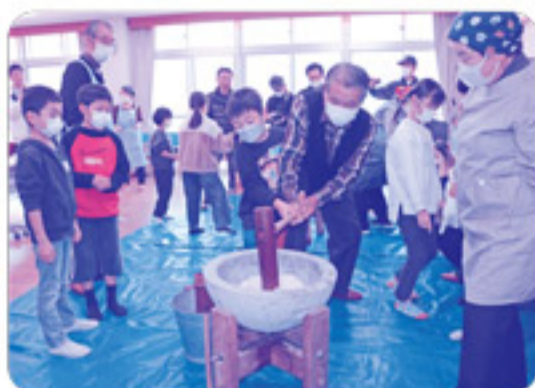
地域の方と一緒に餅をついていきます。