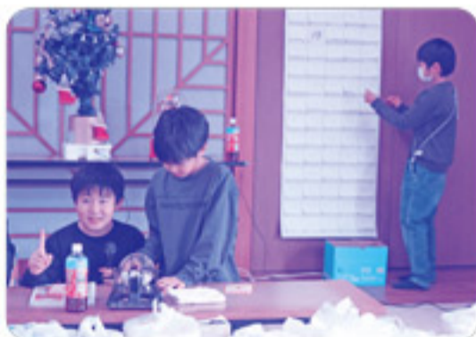
ビンゴゲームでは、子どもたちが上手に司会進行を行いました!