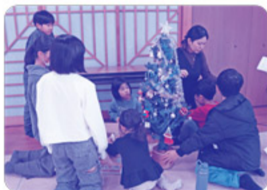
子どもたちがクリスマスツリーに飾り付けをしています。