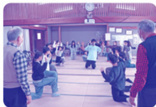
スポーツジムのインストラクターによる体操教室では、子どもも大人も楽しく体を動かしました！