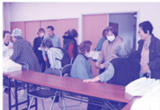
お花見会のお弁当は、外と室内2か所で配られました。