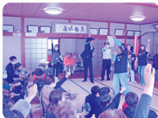
楽しい司会進行で、ビンゴゲームも大盛り上がり！