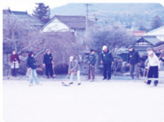
地域の方とグランドゴルフを体験。コツを教わりながら、少しずつ上達しました。