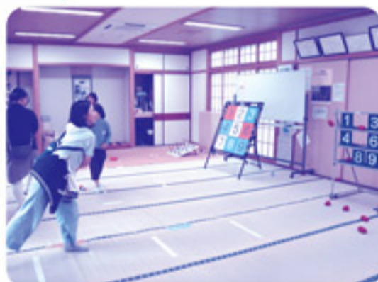
自治会館では、ターゲットゲームや輪投げなどを楽しみました。