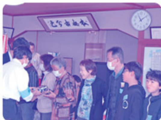
入賞チームの表彰式では、一人ひとりに賞品が手渡されます。