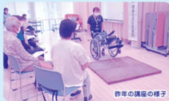
昨年の講座の様子