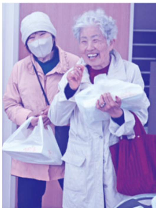
顔なじみのみなさんに会うと、自然と笑顔になります。