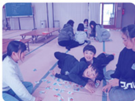
かるた取り大会も行われました。早く札を取ろうとみんな夢中になりました！