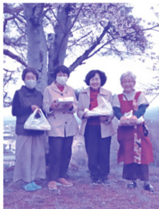
外は雨模様でしたが、楽しいひと時を過ごしました！