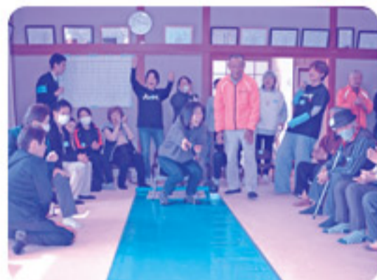
チーム対抗ボーリング大会！会場は笑いと歓声で溢れました！