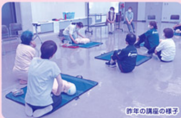
昨年の講座の様子