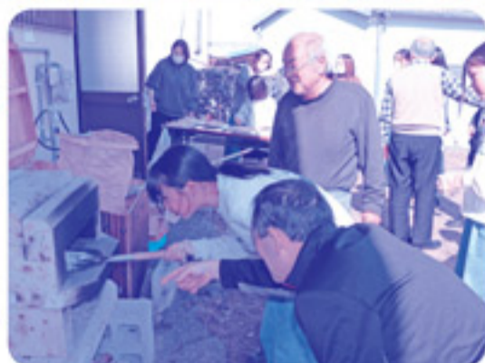
お楽しみのピザ作り体験。自分でトッピングして焼いたピザの味は格別です！