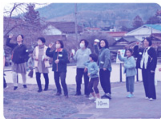
紙飛行機作り教室で作った自信作をみんなで一斉に飛ばします！