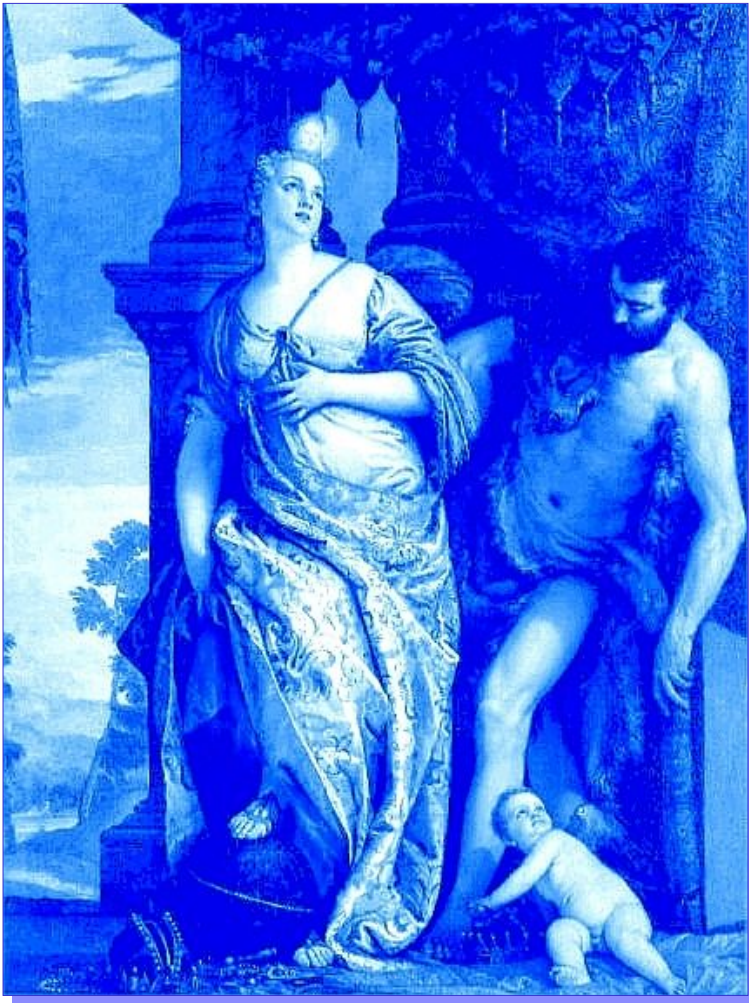
Paolo Veronese (1528-88) / Allegory of Wisdom and Strength