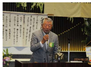
公共イメージ委員長