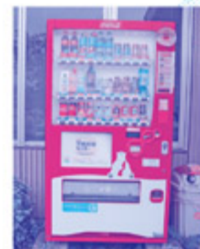
熊野町地域福祉会館入口よこ