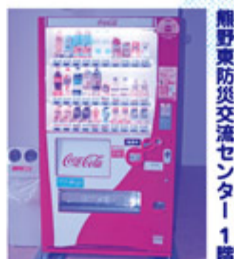
熊野東防災交流センター1階