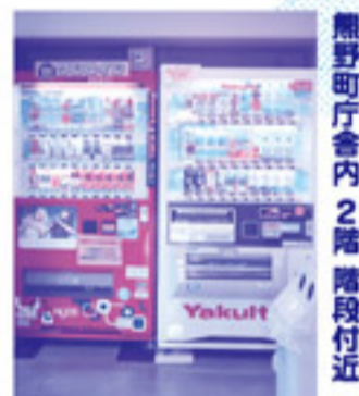
熊野町庁舎内2階階段付近