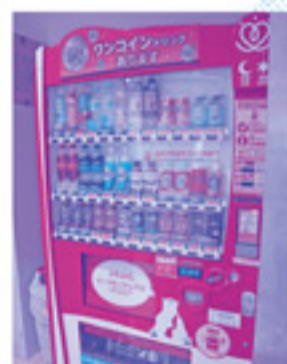
熊野西防災交流センター