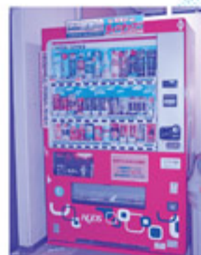
熊野町民会館1階ロビー